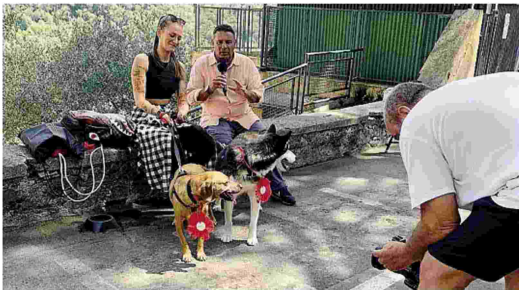
Blu e Balù sono un meticcio di 12 anni e un siberian husky di tre